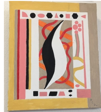
Tableau qui a demandé le moins de temps